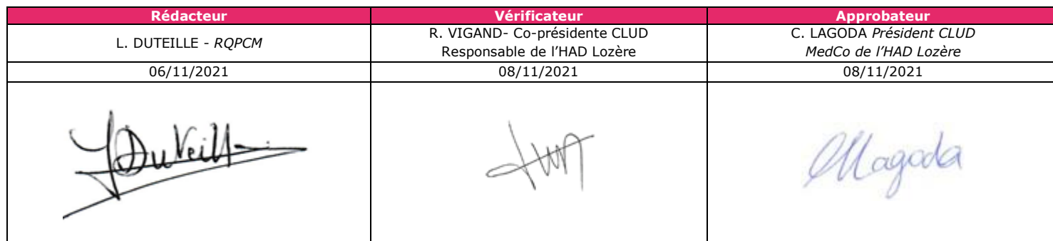
Tableau de validation